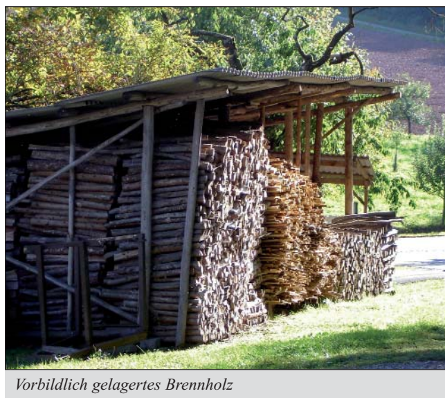
Vorbildlich gelagertes Brennholz

Anlaufstellen sind die Ansprechpartner für Holzenergie an den Ämtern für Land- und Forstwirtschaft und die Zusammenschlüsse der Waldbesitzer. Adressen hierzu finden Sie unter „ www.forst.bayern.de “.